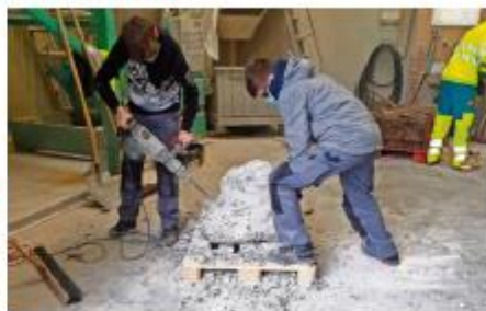
Jugendliche legen sich an den «Bau und Action-Tagen» im Kurszentrum in Effretikon ins Zeug.

An zehn verschiedenen Posten geben Instruktoren des Kurszentrums und zahlreiche Lernende